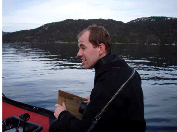
I nøden padler Sdk'ere med fjøler.

Vi er utrolig nok ikke kalde, men ser frem til en oppvarmende padletur. Det er her vi finner ut at den irriterende korte padleåra er av typen "extendeable" så de siste 100 meter kan vi padle meget fortere da den plutselig er dobbelt så lang. Turen tilbake går forbi Vikedal, hvor vraket av den norske bevoktningsbåten "Sperm" ligger og videre via aksdal og Rennesøy til klubbhuset.