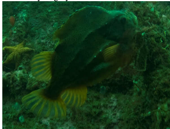
Rognkjeksen forsvarte sitt revir på baugen.

Styrhuset er for lengst spist av pælemarken, men fundamentet står igjen. Foran er forre lasteluke som Vidar svømmer ned i. Bakken er siste stopp på raket her er det også veldig detaljrikt og man kan svømme gjennom trygt og åpent så lenge man har i bakhodet at det står fortøyningsvinsjer og ankerspill over hodet. Detaljene er mange og fremme i baugen treffer vi en pen rognkjeks som forsvarer sitt revir. Bottomtimeren viser 4 grader og nærmere 90 minutt dykketid, manometeret viser noe man ikke forteller padi så vi velger å ta en runde rundt bakken igjen før vi setter kursen mot stranden.