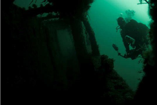
Vidar på stadig jakt etter nye fotomotiv. Bilde fra stbd svalegang ved akterste overbygg.

Man kan lett svømme ned i hekken og opp lederen inn i akterste overbygning. Her er det også dører som går ut i svalegangene både på babord og styrbord side.