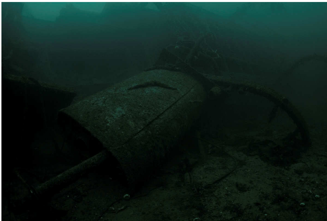
Midtskips på vraket av Stavangeren hvor det er utført berging i maskinrommet. Sikten er meget god og vraket er ellers i meget god stand.