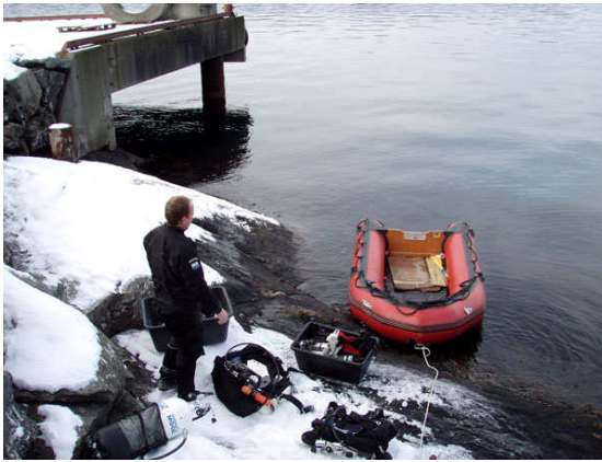
"Lille Lophelia" er klar for ekspedisjon.